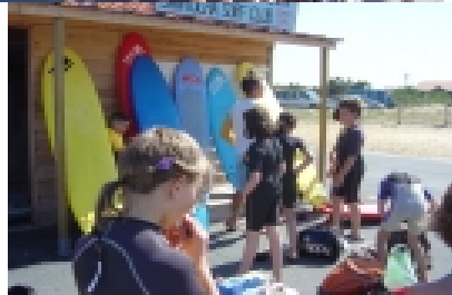
Les conseils de M. Bagattin