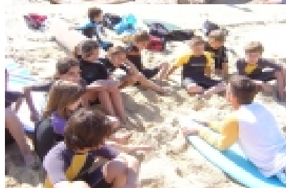
La remontée des planches