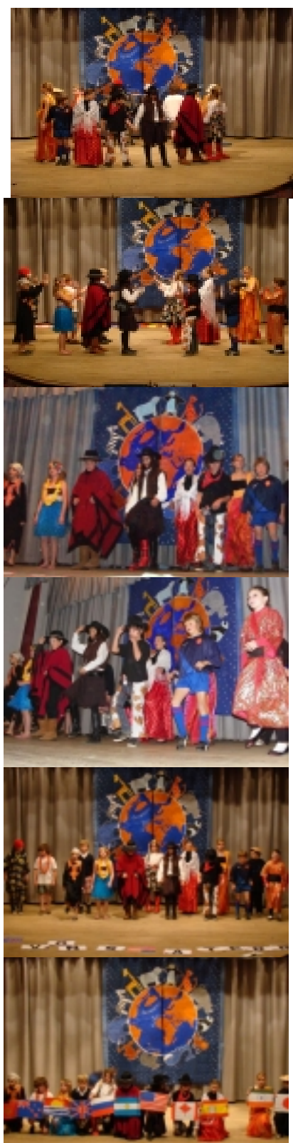
La Terre à moitié pleine & le secret d'Ekholo

Martin finit son voyage par un tour du monde à travers les continents et il apprit que l'eau était polluée et gaspillée. Il comprit alors que si tous les humains étaient plus propres, ce serait la planète qui serait plus propre. Il savait que c'était à lui de les convaincre de changer les choses.