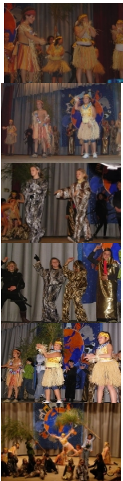
Les ruisseaux de larmes (CM2)

des milliers d'espèces de plantes et d'animaux y vivaient, qui pourraient être très utiles à l'homme un jour.